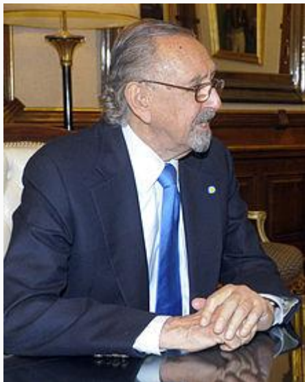
César Pelli en 2010