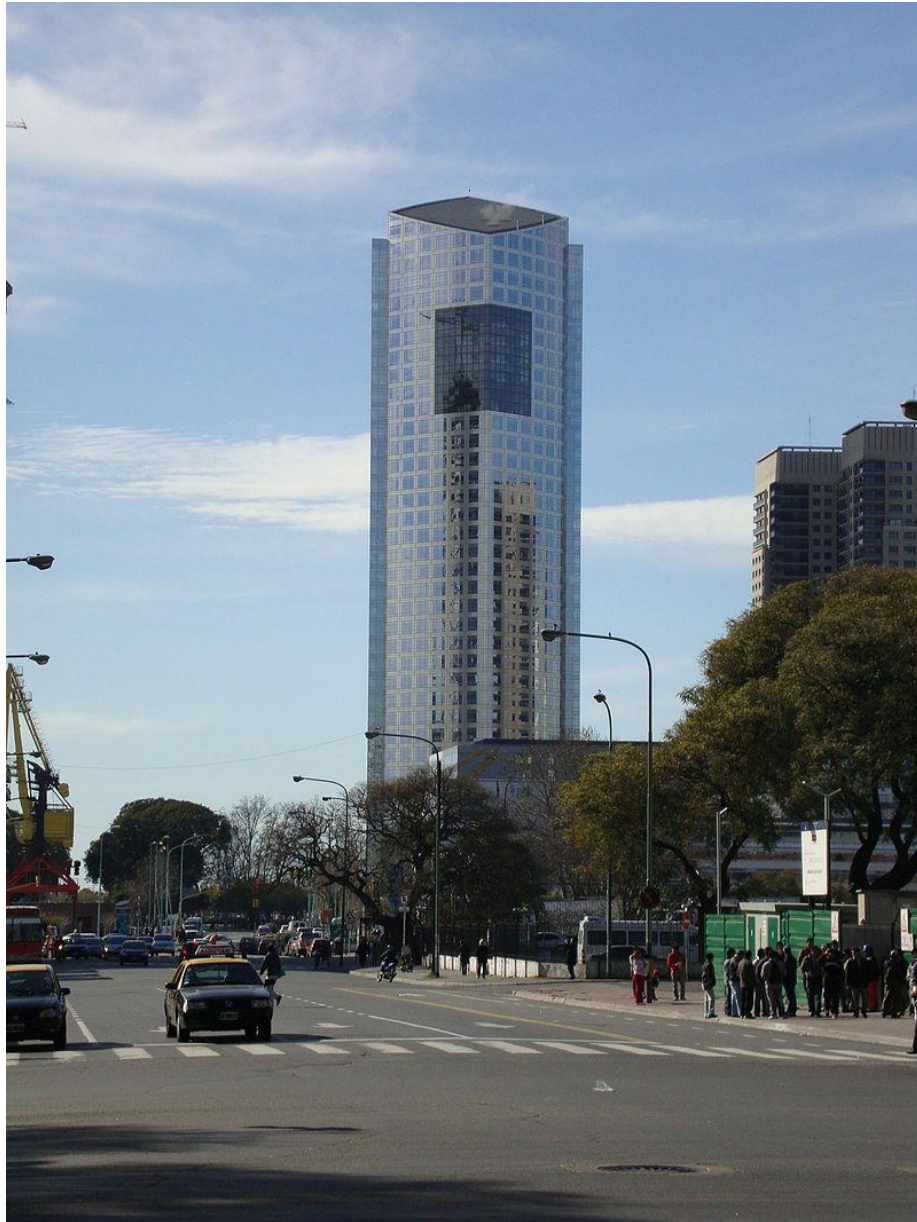
Torre YPF en Argentina .