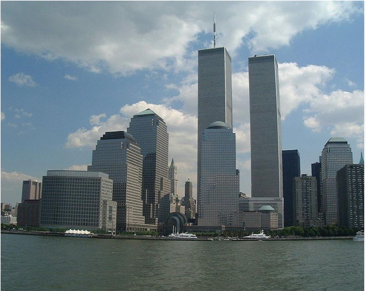
El World Financial Center , antes de los atentados del 11 de septiembre de 2001 en Estados Unidos .