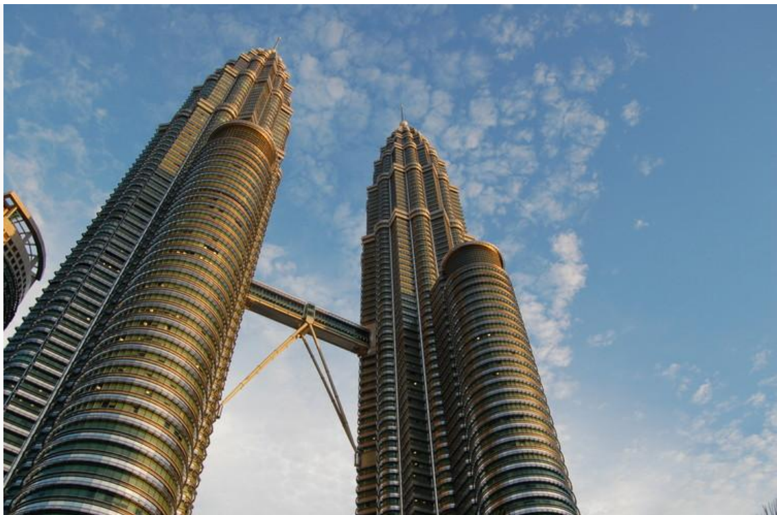
Las Torres Petronas en la ciudad de Kuala Lumpur , Malasia .